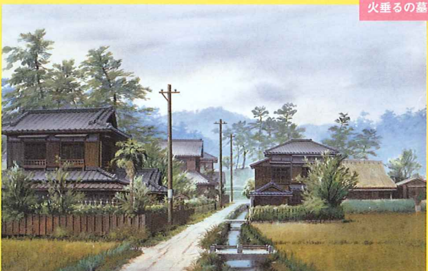
火垂るの墓《疎開先》1988年 ©野坂昭如/新潮社,1988 ©山本二三