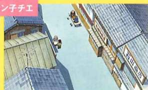
ジャリン子チエ《関だまり》1981年 ©はるき悦日/双葉社・東宝 ユニバーサルミュージック・TMS ©山本二三