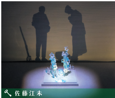
🔍 佐藤江未 Pride of Bag closures: type Angelus ©emi SATO 日用品などを集合体にした造形に光を当てると、想像もできないような影が壁に現れます。