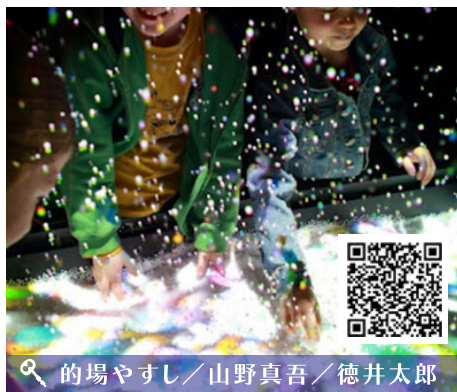
🔍 的場やすし / 山野真吾 / 徳井太郎 SplashDisplay ©yasushi MATOBA / shingo YAMANO / taro TOKUI 動きまわるとボールを当てると、色とりどりの粒が噴水のように舞上がります。