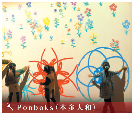
🔍 Ponboks (本多大和) ユビサキに咲く ©Ponboks (yamato HONDA) 指先から一度に複数の花びらが描かれて花が咲き、少しずつ花畑が広がっていきます。