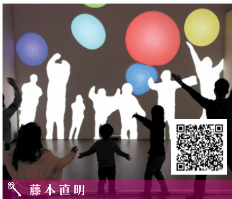
🔍 藤本直明 Immersive Shadow: Bubbles ©naoaki FUJIMOTO 壁に映し出された柔らかいボールを、人の影で触ったり弾いたりすることができます。