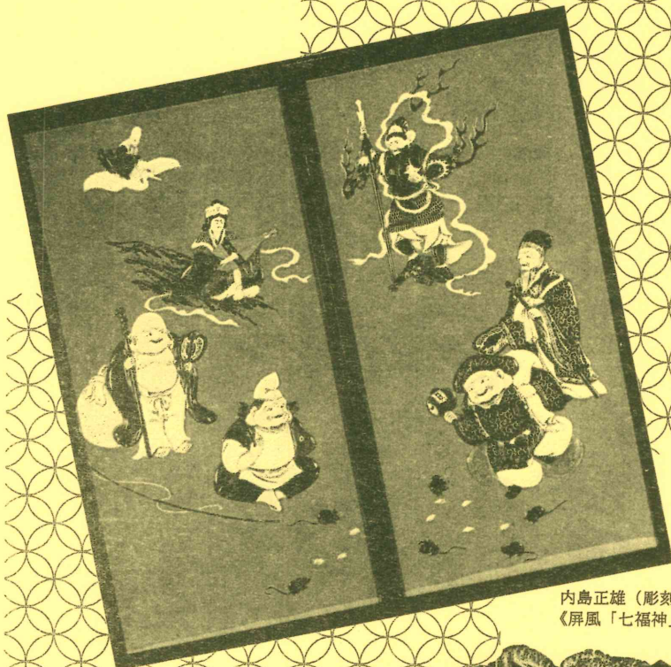
内島正雄（彫刻 室谷芳月） 《屏風「七福神」》1990年代