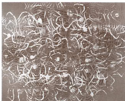
鶴谷 登 《作品 89-1》 1989年 富山県(県立高岡工芸高等学校)蔵