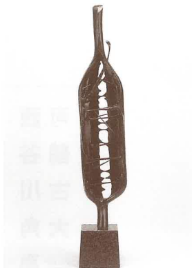
大角 勲 《ねばり》 1973年 高岡市美術館蔵