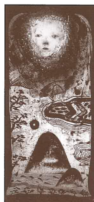
古川 通泰 《視る》 1987年 富山県(県立高岡工芸高等学校)蔵