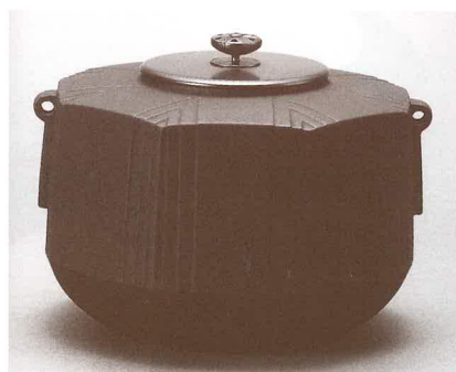
二代 畠 春斎 《筋文八方釜》 2003年 高岡市美術館蔵